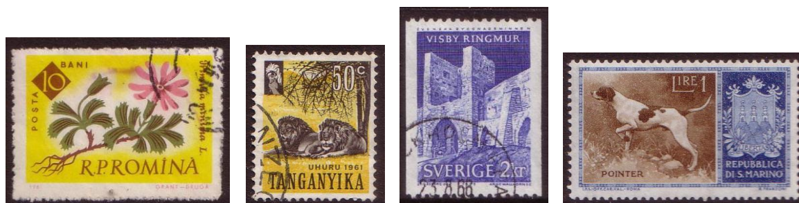
Färger och former som uppskattades av den mycket unge samlaren